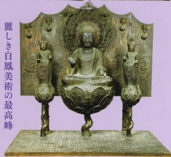
国宝 阿弥陀如来および両脇侍像(伝橋夫人念持仏) 飛鳥時代・7~8世紀 奈良・法隆寺蔵