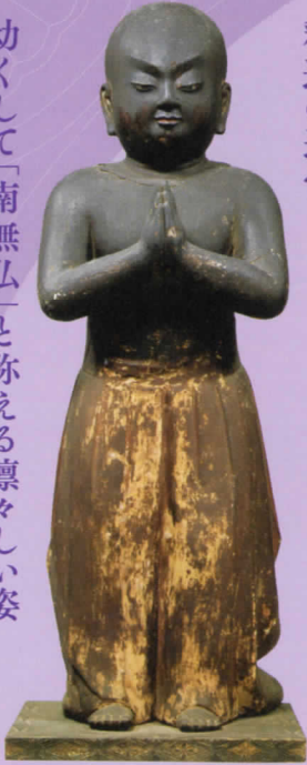
聖徳太子立像(二歳像) 鎌倉時代・徳治2年(1307) 奈良・法隆寺