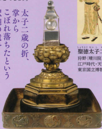
南無仏舍利 舍利塔:南北朝時代 貞和3~4年(1347~48)、 舍利据箱:鎌倉時代 13世紀 奈良・法隆寺蔵