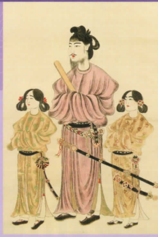
聖徳太子二王子像(模本) 狩野(晴川院)養信筆 江戸時代・天保13年(1842) 東京国立博物館蔵