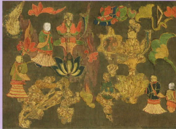
国宝 天寿国繡帳 飛鳥時代・推古天皇30年(622)頃 奈良・中宮寺蔵 [前期]